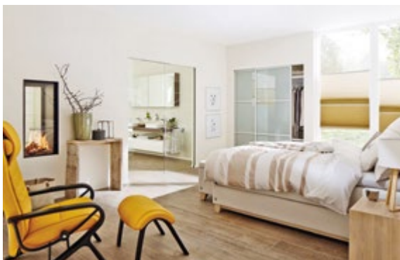
Différentes utilisations possibles du système Pocket Kit

Dès que l'entrepreneur spécialisé ou l'entreprise de parachèvement dispose des dimensions de la feuille de porte en bois ou en verre que vous en tant qu'architecte-auteur de projet avez prescrite dans votre cahier des charges, il pourra intégrer ce système solide dans la cloison légère en plaques de plâtre en deux temps trois mouvements.